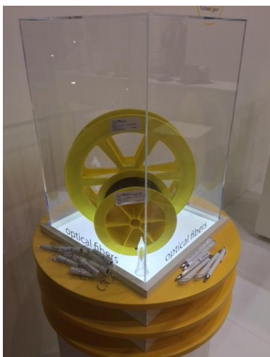
Präsentation optischer Fasern

Aufgrund ihrer hohen Internationalität bot die Messe eine gute Gelegenheit, neue Kontakte zu knüpfen und bestehende Geschäftsbeziehungen zu pflegen. Das Angebot der Messe reichte von Produkten, Detail- und Systemlösungen bis hin zu Anwendungen aus dem weiten Feld der optischen Technologien. Optische Bauelemente, Optomechanik, Faseroptik und Lichtwellenleiter, Laserkomponenten, Beschichtungstechnologien und vor allem die Schlüsseltechnologie Photonik waren hier genauso vertreten wie Systeme der additiven Fertigung, der industriellen Bildverarbeitung und der optischen Messtechnik.