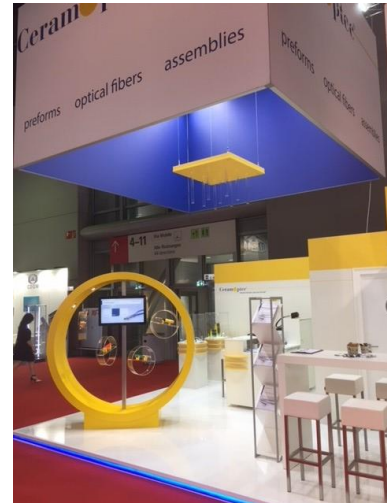
Messestand der CeramOptec

Vom 15. bis 17. Mai fand in Frankfurt a.M. die Optatec 2018, eine internationale Fachmesse für optische Technologien, Komponenten und Systeme, statt. Dort präsentierten sich 540 Aussteller aus 32 Nationen den knapp 6000 Besuchern, die aus 45 Ländern angereist waren. Auch die CeramOptec GmbH war mit ihrem großzügigen Messestand vertreten und zeigte verschiedene Anschauungsobjekte und Modelle, wie z.B. die Optran® UV NCC oder Optran® UV/WF Faser sowie Anschauungsobjekte von Kabelkonfektionierungen.