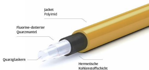
Faser Optran® UV NSS

Der indische Kooperationspartner ist die New Age Instruments & Materials (P) Ltd , ansässig in Haryana, Gurgaon (Indien) und vertreten durch Herrn Tapan. Im Mittelpunkt des Messeauftritts an Stand Nr. 2045 stehen die Fasern Optran® UV NSS und Optran® UV NCC.