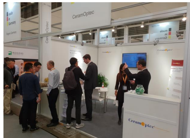
Messestand der CeramOptec