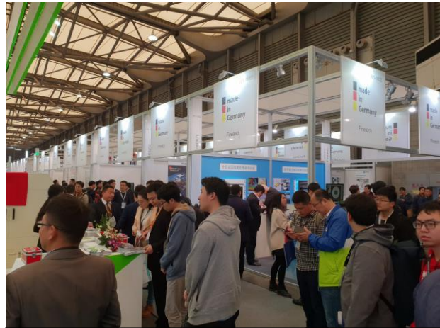
Der Messebereich „Made in Germany“

Ende des ersten Quartals war CeramOptec Teilnehmer auf der Laser World of Photonics China 2019 in Shanghai. Im Bereich „Made in Germany“ präsentierte sich CeramOptec auf dieser internationalen und sehr breitgefächerten Messe. Auf fünf große Bereiche verteilt zeigten sich mehr als 1000 Aussteller aus 26 Ländern den 65 000 Fachbesuchern.